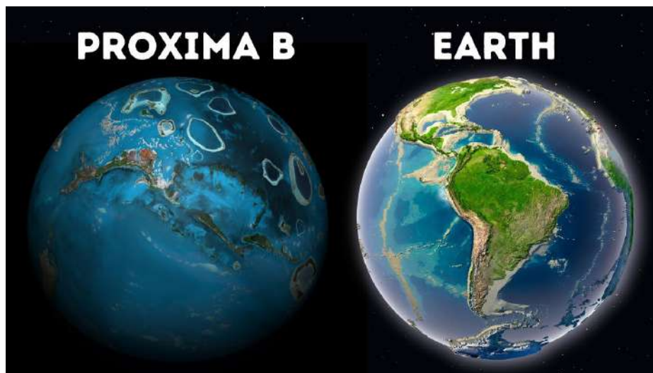
Figura 1: Confronto molto scientificamente accurato tra Proxima B e la Terra.

Dopo lunghi secoli di osservazione del pianeta Terra, la direzione delle Frazioni Unite di Proxima B ha scoperto l'esistenza delle Olimpiadi Italiane di Informatica 2017 a Trento, e ha deciso di inviare una sua delegazione alla prossima edizione! Dopo una dura selezione, il giovane \diamond\aleph\varphi\imath\Delta\sqcap\imath \quad \sqcap'\imath\sqcup\neq\diamond\vartheta\kappa\Delta+\imath\sqsubseteq\Delta ha guadagnato il suo posto nella delegazione, e si sta ora preparando per il lungo viaggio verso la Terra, che durerà ben 150 anni di Proxima B, corrispondenti a poco meno di 5 anni solari.